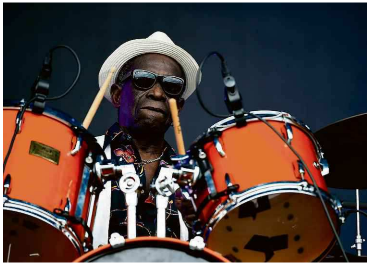
Tony Allen in 2015.