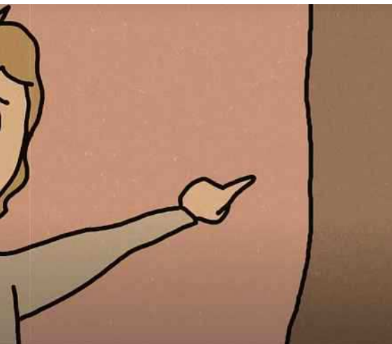
Op de cover: Het campagnebeeld van Van oude dingen, de mensen die voorbijgaan.